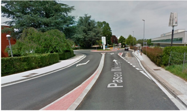
Entrada Parque Tecnológico