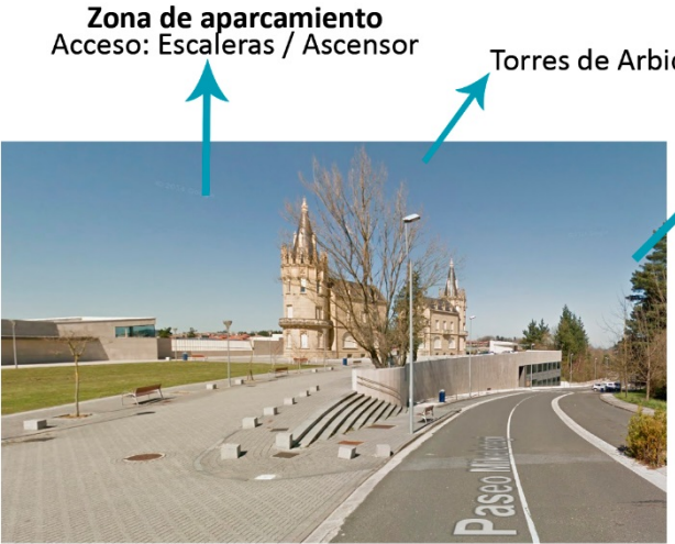
Zona de aparcamiento Acceso: Escaleras / Ascensor