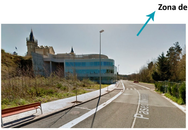
Zona de aparcamiento